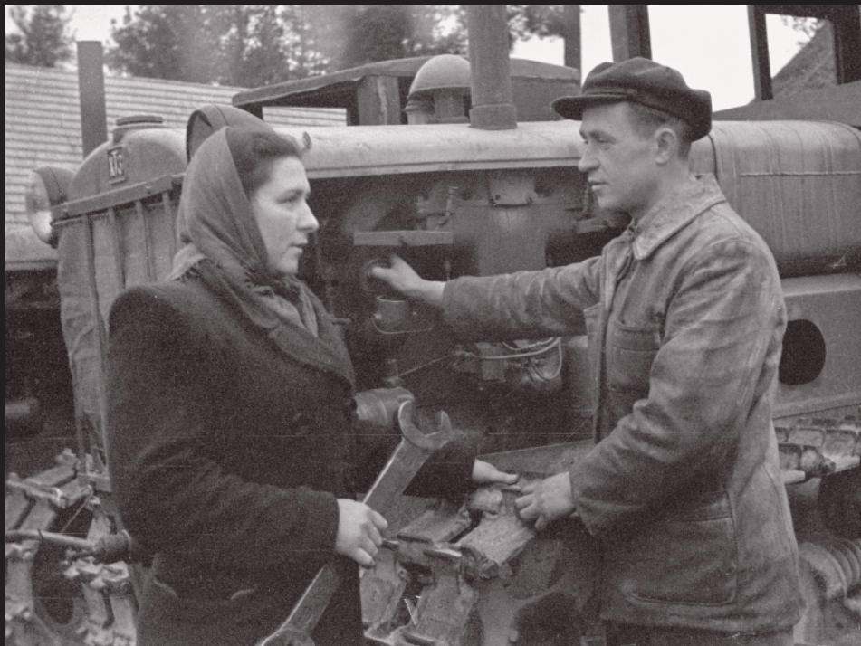
Mechanikas ir traktorininkė apžiūri traktoriaus variklį. Fot. L. Morozovas, 1949.