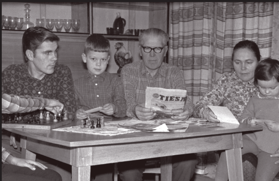
Šeimos laisvalaikis namuose. Fot. S. Katinas, 1970.