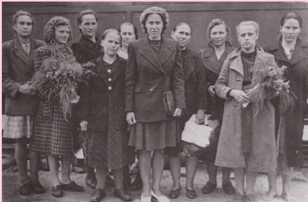
Pirmojo moterų-kolūkiečių suvažiavimo delegatės uteniškės, 1948.