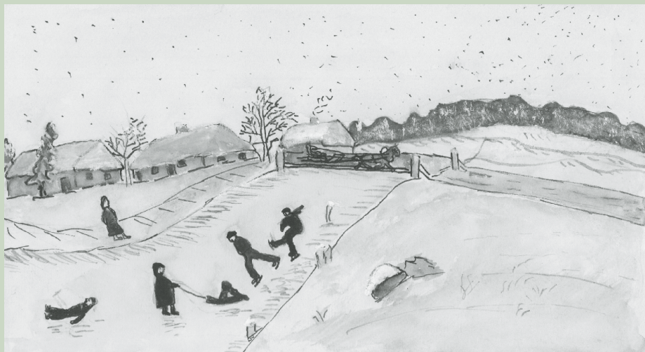
Gimnazisto Puzino piešinys „Žiema“, 1940 m. Lietuvių literatūros ir meno archyvas