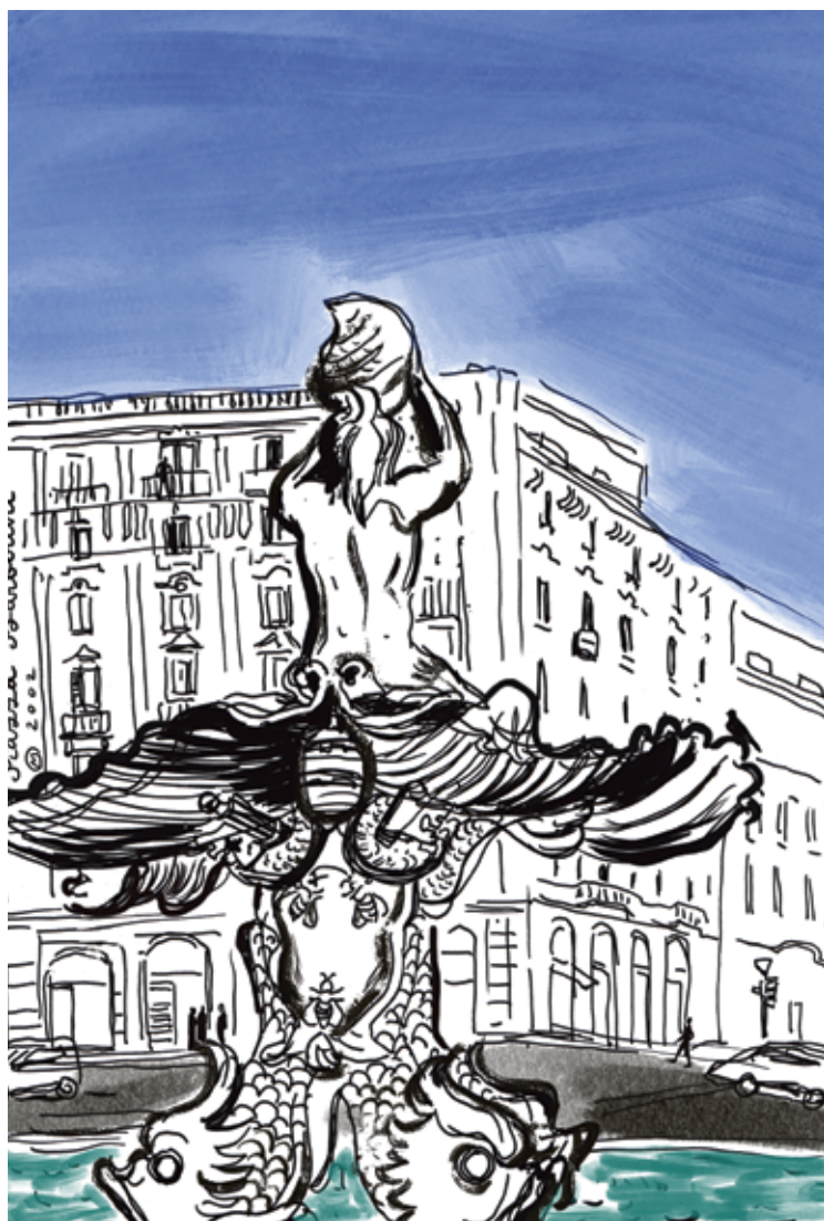
Barberini aikštė su Tritono fontanu

jau tinklinėmis tapusios „Grom“ ir „La Romana“, kur ledų ragelis paskaninamas karštu šokoladu, į Romą atkeliavo būtent iš šiaurės. Kiekviename kvartale yra savo ledų „šventovė“. Kai kurios pagarsėja ir paplinta už gimtojo kvartalo ribų.