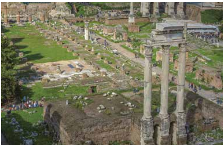
Trys kolonos, žyminčios Dioskūrų Kastoro ir Polukso šventovės liekanas

apie romėnų pergalę. Jiems dedikuota šventykla forume primena šį stebuklą ir Regilo mūšį.